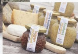
Stroomdal Runsloot Yde